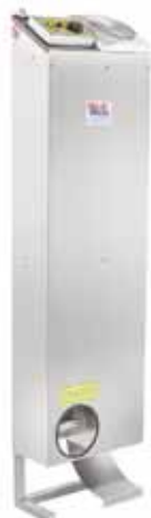
Klima-unit AK-3 for raskeskabe

Klima-unit AK-3 for raskeskabe – temperatur og fugtighedskontrol. Raske-enheden sørger for at de ønskede fugtigheds- og temperaturparametre hurtigt opnås unit adjusts their values itself. Innovative steam generation system use special electrodes submerged in water.