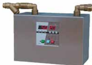
Vandblander med elektronisk styring

Til bagerier og andre steder, der bruger vand i produktionsprocessen, med behov for at kunne dosere vand med specifikke temperaturer.