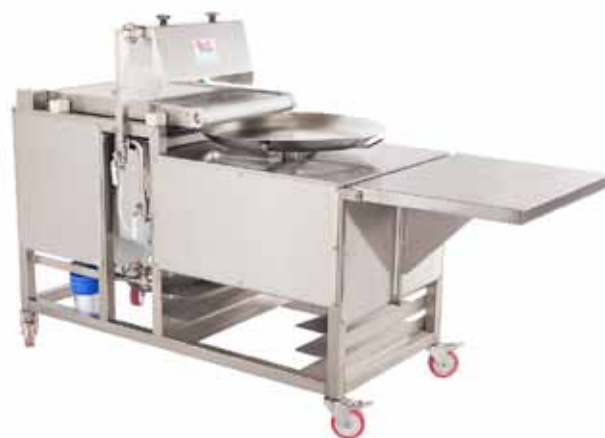
Vand-sprøjtesystem og frø-dosering

Vand-sprøjtesystem og frø-dosering CIA-3. Dimensioner 1950x830x1350mm