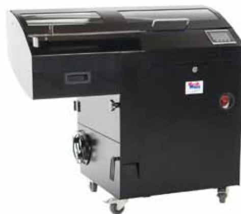
Model KT-2 skærer brød