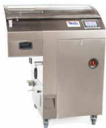
Model KT-1 skærer brød