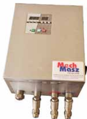
Vandblander med elektronisk styring

Til bagerier og andre steder, der bruger vand i produktionsprocessen, med behov for at kunne dosere vand med specifikke temperaturer.