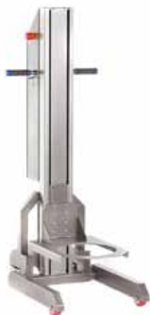
Lifter HUB 1. 100 kg