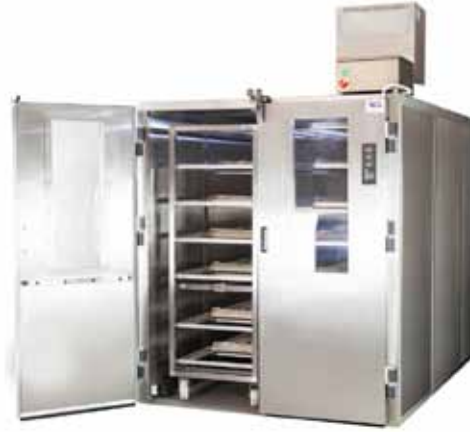
Tilpasset kommercielt raskeskab